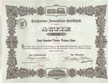
Cuxhavener Immobilien-Gesellschaft Gründeraktie 200 Thaler von 1872 Schätzwert 1.250,- Euro