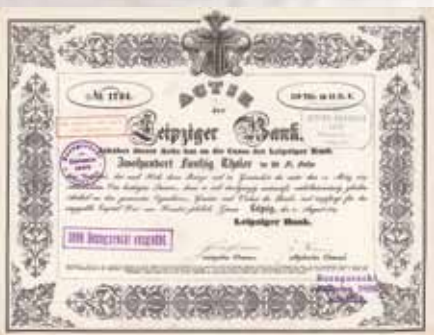
Leipziger Bank Gründeraktie 250 Thaler von 1839 Schätzwert 1.000,- Euro