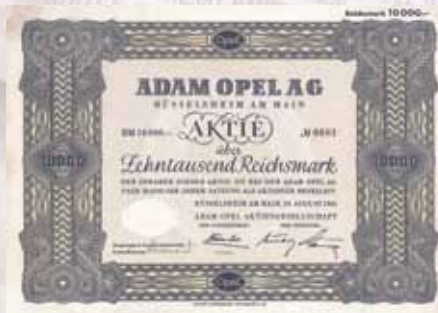
Adam Opel AG, Rüsselsheim Aktie 750 RM von 1941 Schätzwert 750,- Euro