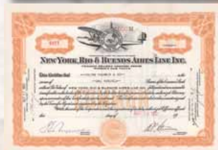
New York, Rio & Buenos Aires Line Inc. 100 common shares von 1931 Schätzwert 500,- Euro