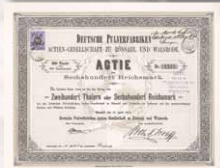
Deutsche Pulverfabriken AG zu Rönsahl und Walsrode Gründeraktie 600 Mark = 200 Thaler von 1873 Schätzwert 1.500,- Euro