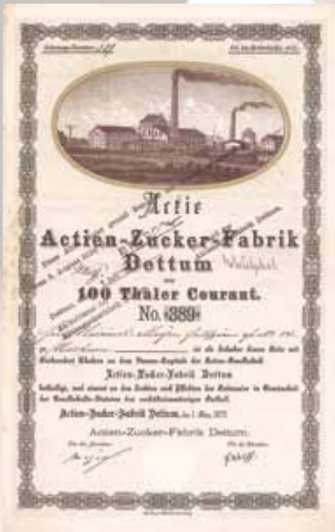
Actien-Zucker-Fabrik Dettum Gründeraktie 100 Thaler von 1872 Schätzwert 750,- Euro

Selbstverständlich können sich am Bieten auf die Blind Dates auch Schriftbieter beteiligen! Sollte tatsächlich ein Schriftbieter der Höchstbieter bleiben, dann wird an seiner Stelle im Auktionssaal die jüngste anwesende Dame als Glücksfee die zu enthüllende Staffelei bestimmen.